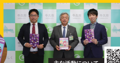
主な活動について詳しくはこちら

市内小学校に入学する新1年生に対して「茨城アストロプラネッツ」の自由帳を寄贈を受けています(令和5年度で2回目の実施)。