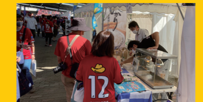
場内に牛久市ブースを出展

フレンドリータウンデイ「牛久の日」を年に1回開催。無料招待企画や、会場内で牛久市の名所や特産品紹介を実施し、観光や産業の振興を図っています。