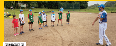
うしくっ子体力向上プロジェクトについて詳しくはこちら

同プロジェクトのプログラムの一環として元選手による教室を開催。投げる動作を通しての運動機能の向上などについて子どもたちに指導を行いました。また、感染症による活動自粛期には、オンラインでのキャッチボール企画を実施しました。