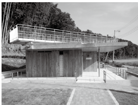
新しくなった「うしく観光アヤメ園」のトイレと駐車場

「うしく観光アヤメ園」のトイレと駐車場の改修工事が完了し、9月から利用可能となりました。新しいトイレは、牛久沼に臨む緑豊かな里山の風景にあわせて水辺空間も設けたほか、外階段を付けて屋上を展望デッキとして利用できるようにしました。展望デッキからは、アヤメ園をはじめ、牛久沼周辺の風景を年間を通じて楽しめます。駐車場は、新たに身障者用を2台分、マイクロバス用を2台分確保しました。なお、多くの方に安全にご利用いただけるよう、防犯のため夜間は施錠します。